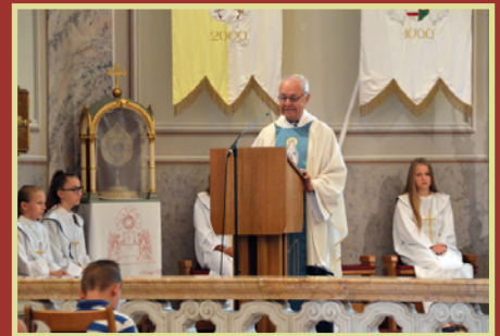
Búcsúmise és tέρzene